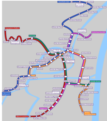
FIGURE 1 – reseau du tramway

S'agit-il d'un graphe? Est-il connexe ? Comporte t-il un cycle ? Est-il complet ?