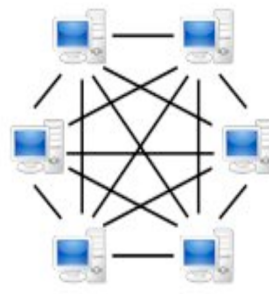
FIGURE 2 – reseau